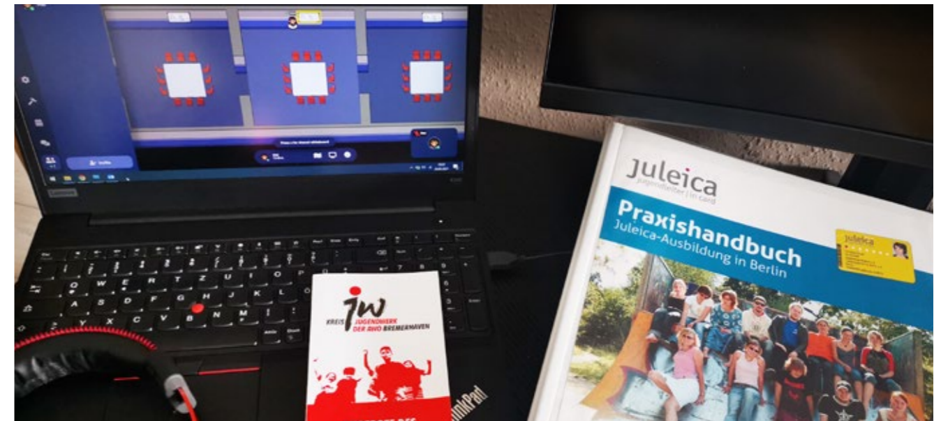
Das geht auch online: Für die Ausbildung von Jugendgruppenleiter*innen griff das Kreisjugendwerk der AWO Bremerhaven auf digitale Kommunikationsmittel zurück.